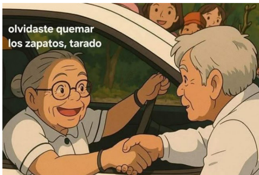
Imagen 4. Afirmación de colaboración entre narcotraficantes y el gobierno.