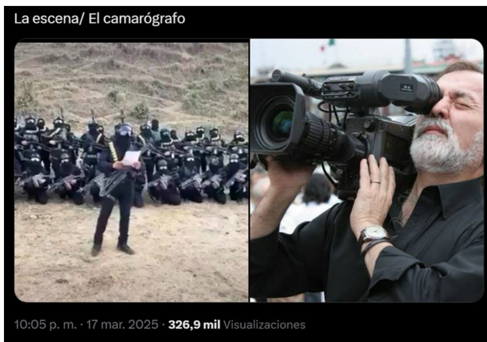
Imagen 2. Afirmación de colaboración entre narcotraficantes y el gobierno.