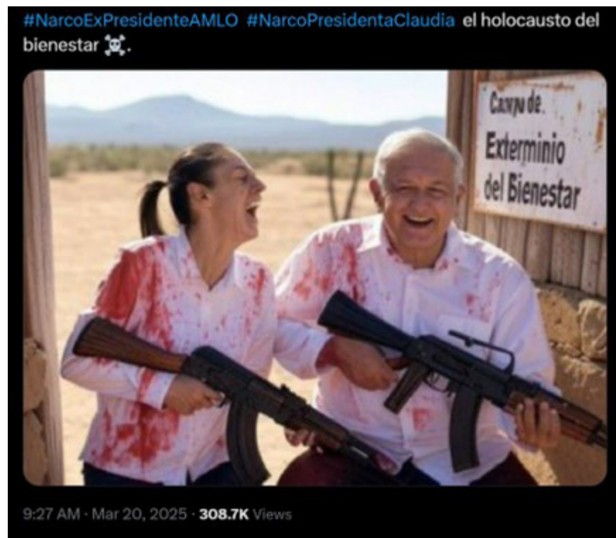
Imagen 1. Señalamiento de la responsabilidad del gobierno por la inseguridad en el país.