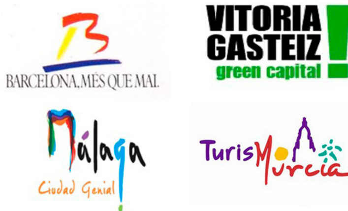
Imagen 2. Logos de las marcas Murcia, Barcelona, Málaga y Vitoria-Gasteiz.

Con estas premisas, hemos comparado los distintos procesos electorales de los cuatro municipios coincidiendo con la etapa política en la que primaron los discursos de la marca ciudad previos a los comicios locales, es decir: las elecciones municipales de mayo de 1991 en Barcelona; los comicios de junio 1999 en Málaga; las elecciones de mayo 2011 en Vitoria-Gasteiz; y las últimas elecciones celebradas en el municipio de Murcia en mayo de 2019.