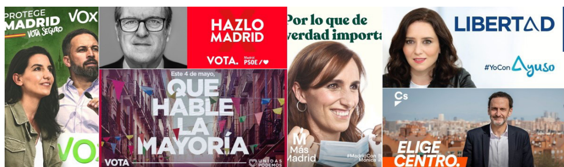
Imagen 1. Carteles electorales campaña autonómicas Madrid 2021.