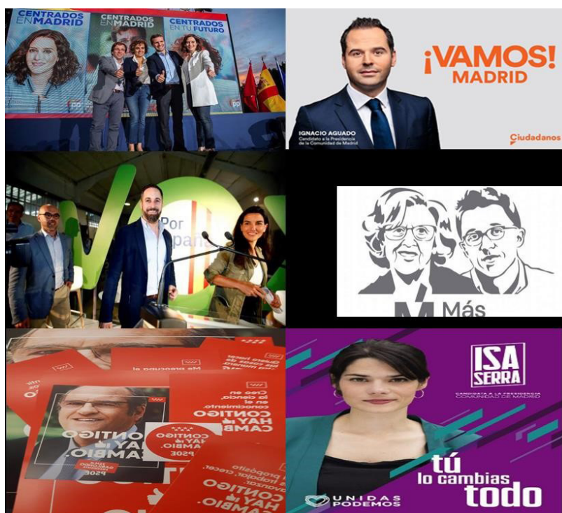
Imagen 2. Carteles electorales campaña autonómicas Madrid 2019.