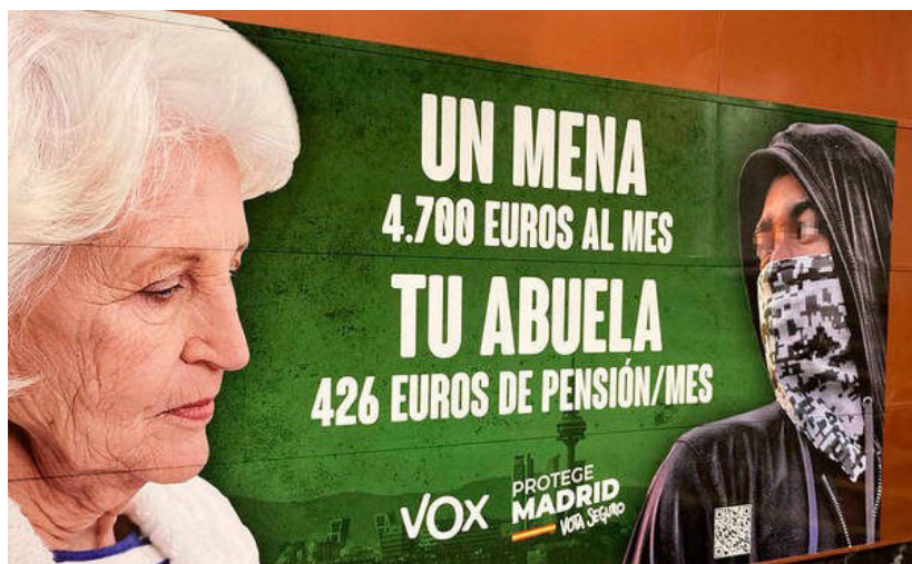
Imagen 3. Cartel electoral de Vox sobre los menas. Campaña autonómica Madrid 2021.